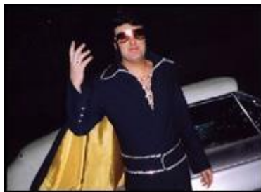
Český Elvis kyne před Palácem Akropolis

Dokument Igora Chauna o jedinečnosti naší rokenrolové scény! Proměny doby na pozadí rokenrolové hudby!